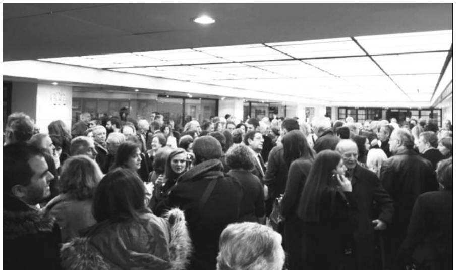
Η δεξίωση στο φουαγιέ του Μεγάρου.