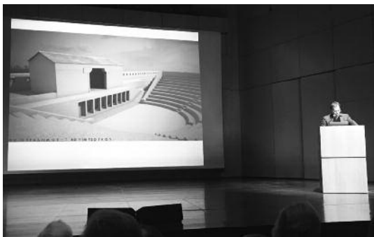
Το θέατρο στην αρχαία εποχή

Το κοίλο είναι διαμορφωμένο σε τεχνητό πρανές και έχει ημικυκλικό σχήμα. Η καμπυλότητά του ακολουθεί την καμπυλότητα της ορχήστρας. Οι απολήξεις του κοίλου ανατολικά και δυτικά συμπληρώνονται με αναλημματικούς τοίχους, με έντονα άνισα μήκη. Χωρίζεται ακτινωτά από τρεις κλίμακες, ενώ δεν υπάρ-