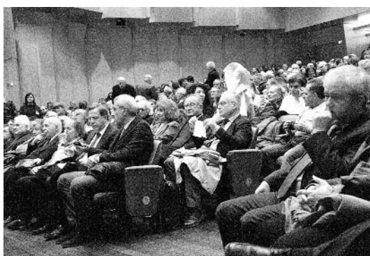
Αποψη της κατάμαστης αίθουσας "Δημ. Μητρόπουλος"

Τα τέσσερα πρώτα άνδρα (I-IV) της άνω πόλεως, που βρίσκονται στα ανατολικά, θα πρέπει να καταλαμβάνονταν από ιδιωτικές οικίες και δημόσια κτήρια. Πρόσφατες ανασκαφικές έρευνες στα άνδρα III-IV αποκάλυψαν μεγάλο ορθογώνιο κτήριο με πέντε χώρους, διμερές κτήριο με υπαίθρια αυλή και εργαστηριακή ενδεχομένως χρήση, καθώς και μικρό μονόχωρο κτήριο με μήκος πλευράς 3,40μ., περιβαλλόμενο με κίονες, που παραπέμπει στο αντίστοιχο περίστυλο οικοδόμημα που έχει αποκαλυφθεί στην Αλίφειρα και έχει ταυτιστεί με Ξενώνα ή κατοικία ιερών. Επίσης, πλησίον ενός από τα δημόσια οικοδομήματα, αποκαλύφθηκε μεγάλη στέρνα νερού, βάθους 4,20μ που απολήγει σε κυκλικό στόμιο με διάμετρο 1μ. Όλα τα παραπάνω χρονολογούνται στην ύστερη κλασική-ελληνιστική εποχή. Στο πέμπτο άνδρα (V) θα πρέπει να βρισκόταν η αγορά της αρχαίας πόλης, η οποία είναι τοποθετημένη σε ένα επιμελώς ισοπεδωμένο τμήμα με μεγάλη δεξαμενή λαξευμένη στο φυσικό ασβεστολιθικό βράχο. Στο έκτο άνδρα (VI) βρίσκεται το μικρό θέατρο, από το οποίο σώζεται η ορχήστρα, τμήμα της σκηνής και το κοίλο, μνημείο με ιδιαίτερη σημασία καθώς αποτελεί το δεύτερο σωζόμενο θέατρο στην Ηλεία, μαζί με αυτό της αρχαίας Ήλιδας. Το έβδομο άνδρα (VII) που είναι και το υψηλότερο,