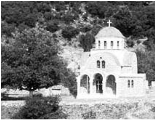
Ο νέος ναός του Αγίου Νικολάου που ανηγέρθη το 1977

Οι Τούρκοι των χωριών της Μούνδριζας, Ζάχα και Ζούρτσας, θορυβηθέντες συγκεντρώθηκαν στις 24 Μαρτίου στο Φανάρι και συνεσκέπτονταν περί του πρακτέου.