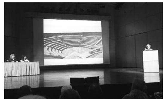
Η πρόταση για την μορφή του θεάτρου μετά την αναστήλωση

Ο χώρος προτείνεται να είναι κατά μέγιστο βαθμό επισκέψιμος κατά τη διάρκεια της επέμβασης και να καταστεί πλήρως επισκέψιμος μετά το πέρας της, πληρώντας όλες τις απαραίτητες προϋποθέσεις σε σχέση με την προσβασιμότητα και την ασφάλεια των επισκεπτών. Η υποδοχή, με πρόβλεψη από τη μελέτη, ήπιων χρήσεων (περίπατος, λειτουργία του αποκατεστημένου θεάτρου ως χώρου θέασης και ακρόασης για μικρό κοινό, κλ.π.) θα επαναπροσδιορίσει τη σχέση του μνημείου και του ευρύτερου αρχαιολογικού χώρου της ακρόπολης με την πόλη και την τοπική κοινωνία, ενώ κάποιες ακόμα παρεμβάσεις μπορούν να προάγουν την ούτως ή άλλως αναμενόμενη λειτουργία του ως τοπόσημου και στοιχείου τοπικής ταυτότητας.