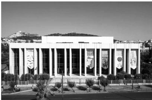
Το Μέγαρο Μουσικής

Κατάμεστη ήταν η αίθουσα "Δημήτρης Μητρόπουλος" στο Μέγαρο Μουσικής Αθηνών, στις 19-01-2016, στη διάλεξη που πραγματοποιήθηκε για την ανάδειξη του Αρχαίου Θεάτρου Πλατιάνας. (Δείτε τη διάλεξη σε βίντεο στον παρακάτω σύνδεσμο: http://www.blod.gr/lectures/Pages/viewlecture.aspx?LectureID=2545 )