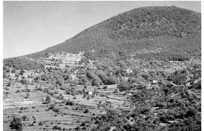
Το όρος Μίνθη

Δ.-Οφείλουσιν οι μαστόροι να έρθωσι περί της οικοδομής και να αρχίσουν εις τας 15 Απριλίου του διατρέχοντος έτους. Το ασβέστι θα το μετακομίζουμε εμείς τα δε λοιπά των μαστόρων. Οφείλωσι οι κάτοικοι μετά των μαστόρων να φέρουσι τα ημίση ποριά. [4]