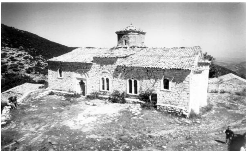
Ο πολιούχος του χωριού σε φωτογραφία του 1965 Καταστράφηκε από τους σεισμούς του έτους 1965.

Όσα γεγονότα αναφέρει στο χειρόγραφό του, τα οποία χρονολογούνται πριν από το έτος γεννήσεώς του είναι προφανώς καταγραφή από μαρτυρίες των προγόνων του ή συγχωριανών του.